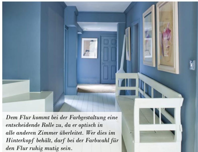
Dem Flur kommt bei der Farbgestaltung eine entscheidende Rolle zu, da er optisch in alle anderen Zimmer überleitet. Wer dies im Hinterkopf behält, darf bei der Farbwahl für den Flur ruhig mutig sein.