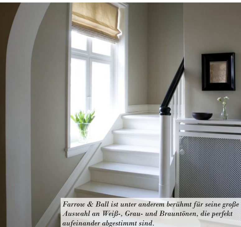
Farrow & Ball ist unter anderem berühmt für seine große Auswahl an Weiß-, Grau- und Brauntönen, die perfekt aufeinander abgestimmt sind.

Im Moment hat Farrow & Ball 132 Farbtöne im Programm. Alle werden ausschließlich im eigenen Werk im beschaulichen